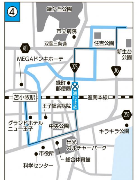
④ 現行 — 12月1日から