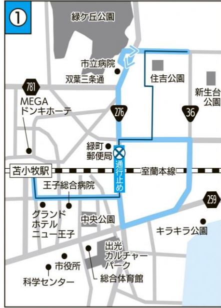
① 現行 — 12月1日から