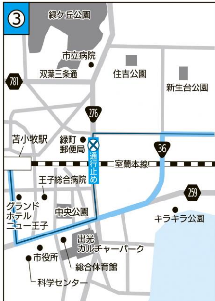
③ 現行 — 12月1日から