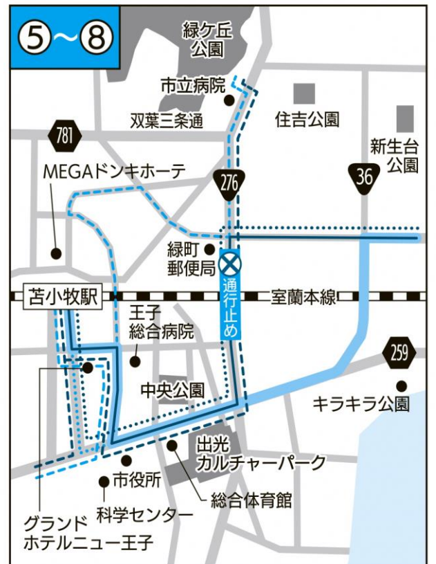
⑤～⑧ 現行 — ⑤・⑥ ……⑦ - -⑧ 12月1日から — ⑤～⑦ - -⑧ ※……は⑦のみ

上記該当路線の各バス停留所の時刻も変更になります。 変更後の時刻などの詳細は弊社ホームページまたは、 下記の営業所へお問い合わせ下さいませようお願い致します。